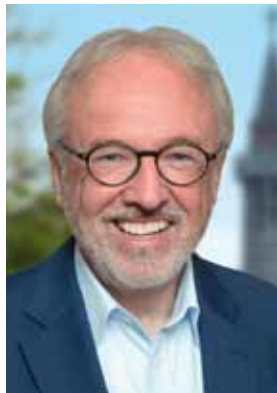
Rudolf Henke, MdB, Schirmherr des Jubiläumsjahres

Alles im Leben hat seine Zeit. Das Buch Kohelet zählt Geborenwerden dazu und Sterben. Zu beiden Zeiten braucht der Mensch seinen Nächsten. Am Ende des Lebens geben Hospize Raum dafür, unser Haus Hörn seit nun 30 Jahren. Bitte helfen Sie mit Ihrer Spende, diesen Raum auch für die Zukunft zu erhalten.